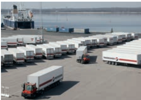
Transport och logistik