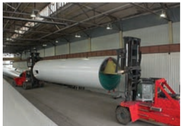
Annan tung industri

How can we make sure your business never stops?